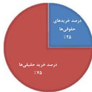
سهم بخش حقیقی و حقوقی از کل معاملات فروش

■ درصد خریدهای حقوقی‌ها ■ درصد خرید حقیقی‌ها